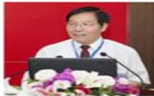
主任：程兴民 西安交通大学 教授